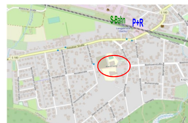
WKZ: Grundschule DD-Langebrück

Versicherung: Jeder Sportler/ Verein zeigt für ausreichenden Versicherungsschutz selbst verantwortlich.